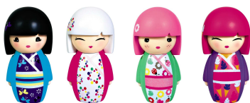
Assortiment de poupées décoratives Kimmi Junior Kontiki Prix public : 11,95€ l'unité