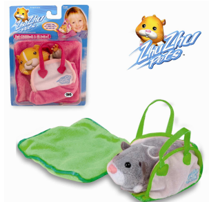
Zhu Zhu Pets Lit et Couverture Giochi Preziosi Prix public : 9,99€