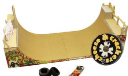
Half Pipe Tag +DVD + Skate Tech Deck Prix public : 29,99€