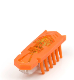
Micro Robot Nano Hexbug Prix public : 9,99€