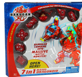
Bakugan 7en 1 Maxus Drago Prix public : 44,99€ EXCLUSIVITE TOYS'R'US

Dominique Jullien, Responsable marketing de Toys'R'Us France , se tient à votre disposition pour décrypter les tendances phare des jouets de la rentrée !