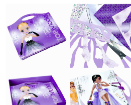
Create your glamour design Pochette creative Top Model Prix public : 14,99€